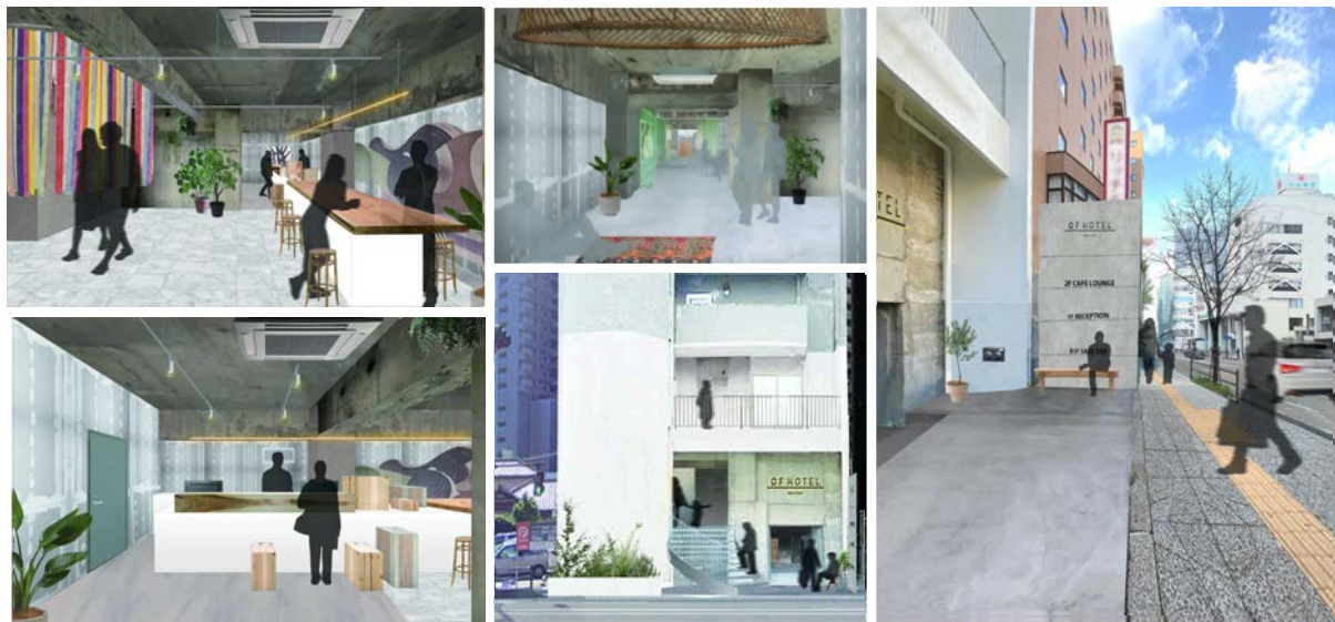
イメージパース：(左上・下) フロントまわり・(中央上) 2F WORKING LOUNGE, COFFEE SHOP, EVENT SPACE (中央下) 外観・正面エントランス (右) 外観サイン・エントランス

「OF HOTEL」公式WEB・予約サイト → https://of-hotel.com/