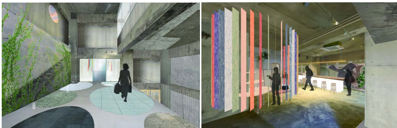
イメージベース：（左）1階エントランス・（右）1階フロント・ロビーエリア

東北に所縁のあるプレイヤーと共創する、一棟丸ごとリノベーションホテルが誕生。 東北の新旧を未来へ引き継ぎ、多種多様な感度の高いワーカーの欲求を満たす、 クリエイティブなビジネス・クリエイションの場を提供する新たなライフスタイルホテル。