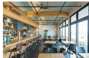
CREATIVE LAB 法人様のプロジェクトを トータルデザイン